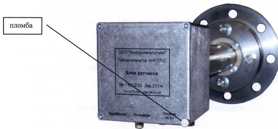
Рисунок 2 – Схема пломбировки газоанализатора

Схема пломбировки приведена на рисунке 2.