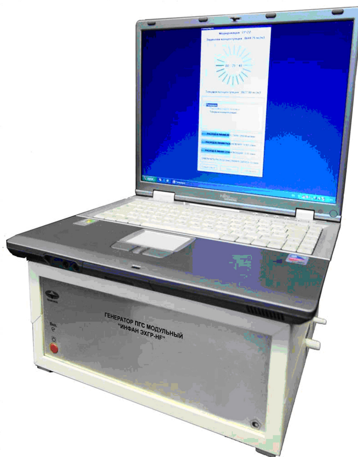
а) блок управления и пневматики и компьютер, вид спереди

Внешний вид генератора представлен на рис. 1.