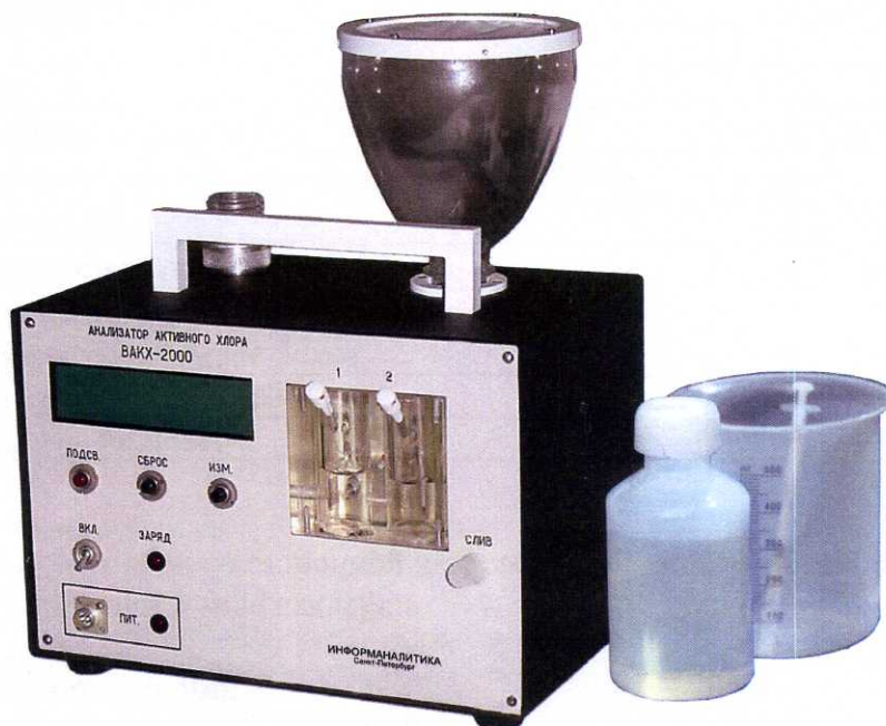
Рисунок 1 – Внешний вид анализатора активного хлора ВАКХ-2000

Внешний вид анализатора представлен на рисунке 1.